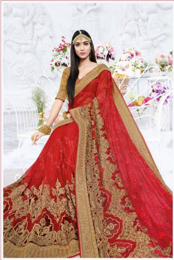
चेरावनी, © सर्वाधिकार: प्रकाशक के अधिकार, (एन वीसीएफ़ि डिजाइन का किसी भी प्रकार का दुरुपयोग करना कानूनी अपराध है)