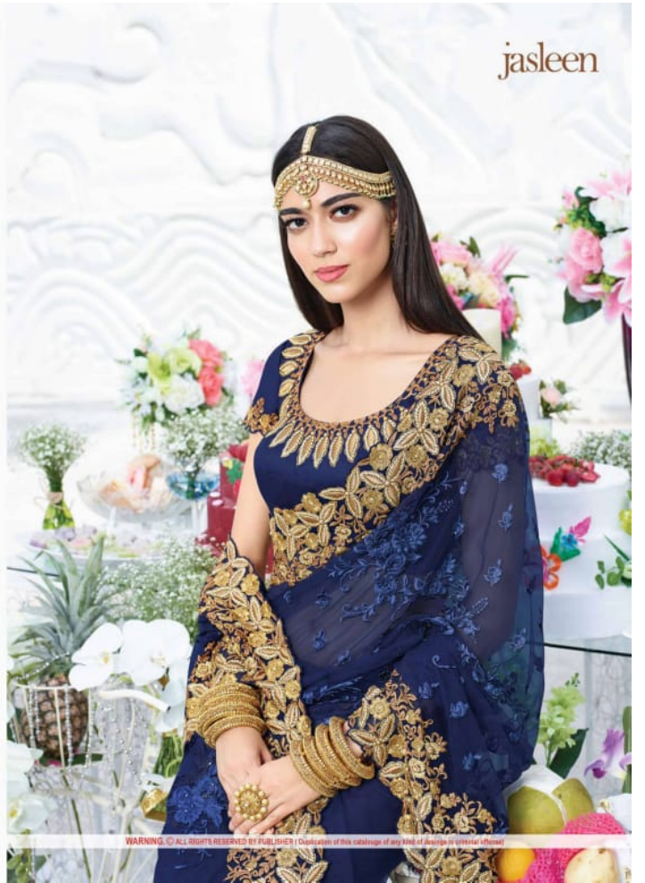
WARNING © ALL RIGHTS RESERVED BY PUBLISHER | Duplication of this copyright of any kind of Jasleen is strictly prohibited