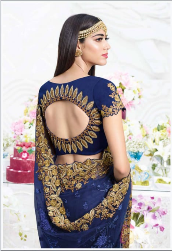
वेदावनी. © सर्वाधिकार सुरक्षित के अंतर्गत, (एक ही व्यक्ति द्वारा लिखित या किसी भी प्रकार का दूरस्थित संचालन वास्तु में अस्वीकृत)