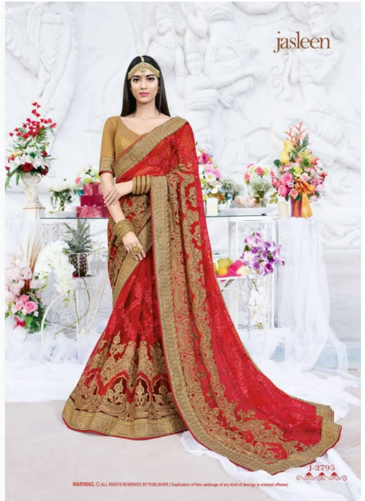
WARNING, © ALL RIGHTS RESERVED BY PUBLISHER | Duplication of this catalogue of any kind of designs is criminal offense